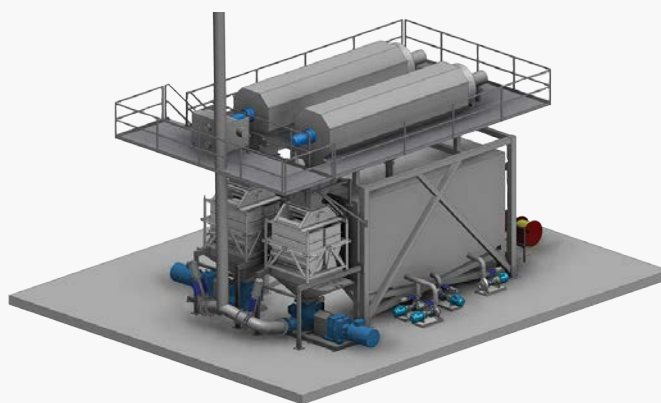
Sistema de pesagem e drenagem de peixes – duplo